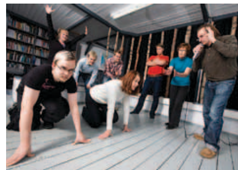
Kajaanin Intotalon opiskelijoita valmennetaan yrittäjyyteen ja myös osuustoimintaan.

Intotalossa on myös yrittäjyyskursseja näille koulutasoille. Projektiopintoja voidaan liittää suoraan osaksi tutkintoa ammattiopistossa, lukiossa, ammattikorkeakoulussa ja yliopistossa.